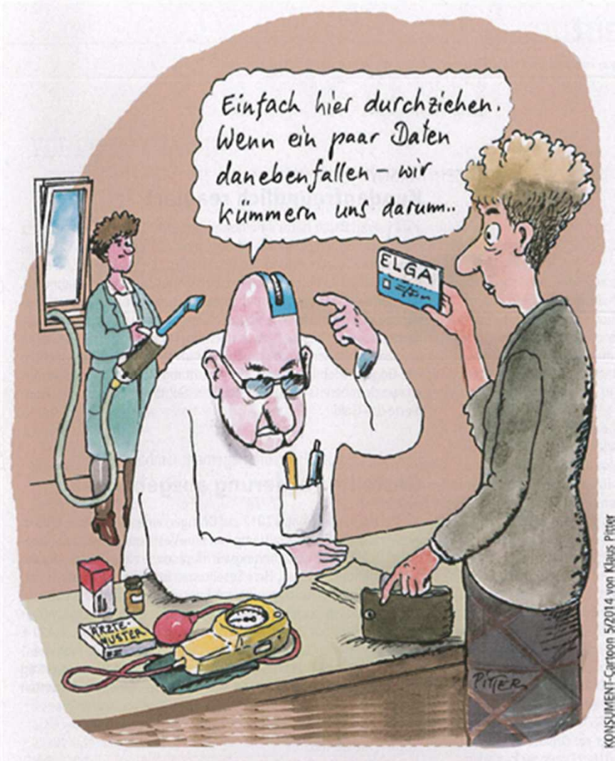
Quelle: Konsument 5/2014