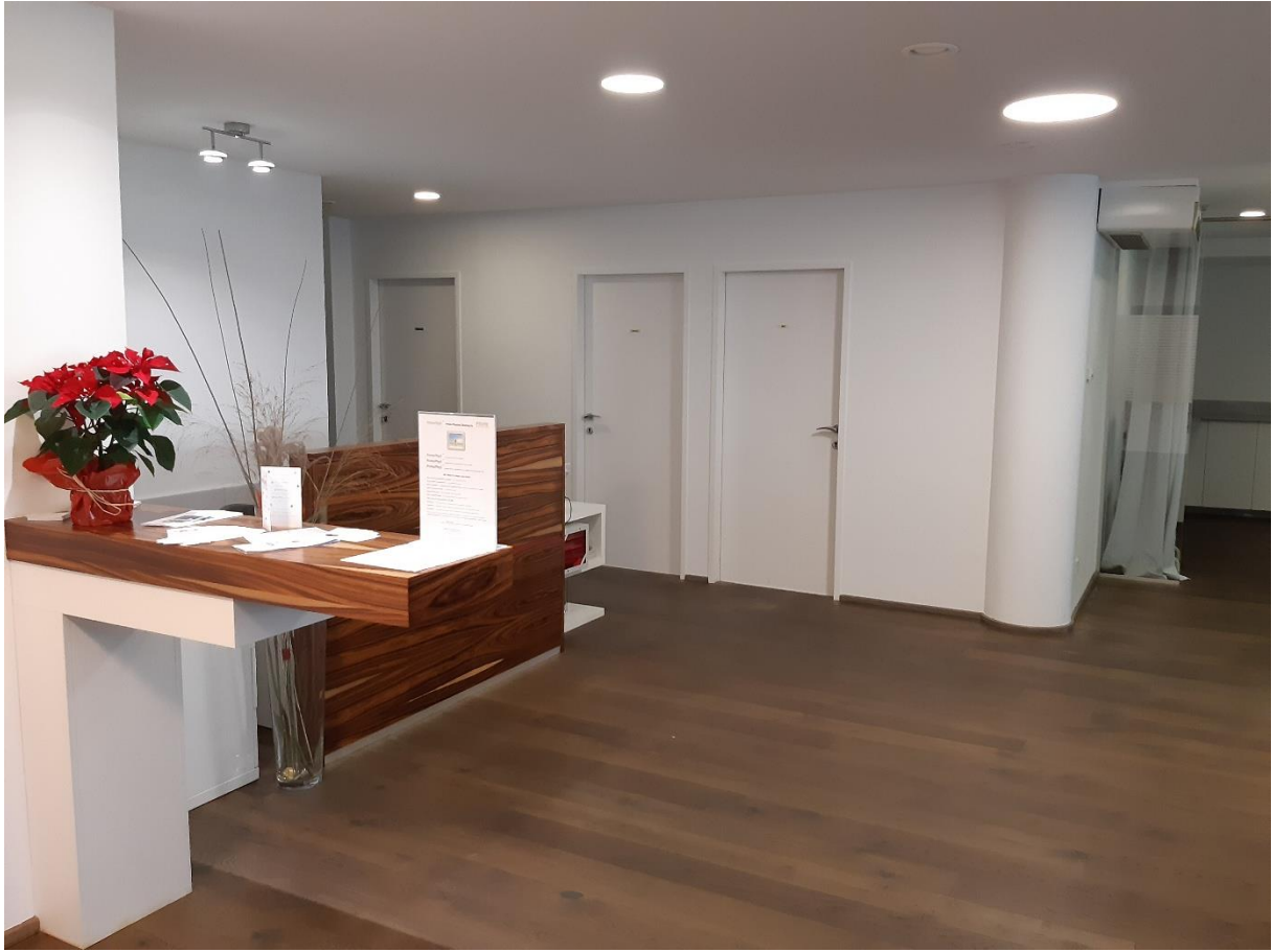
Empfangsbereich mit Zugang zu WCs und Mitarbeiterküche