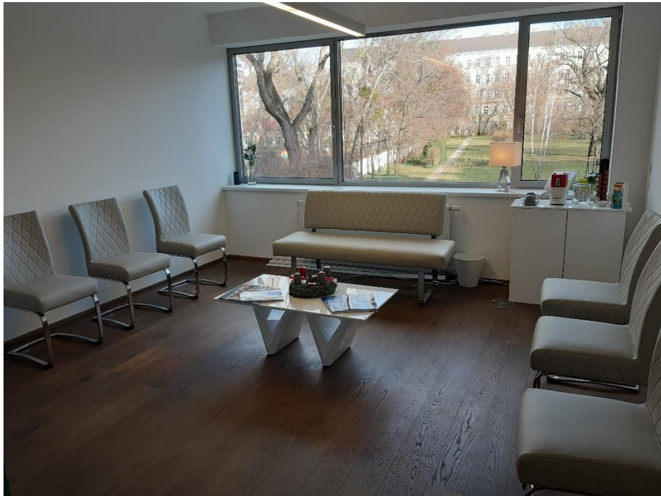
Wartebereich, Behandlungsraum mit Parkblick